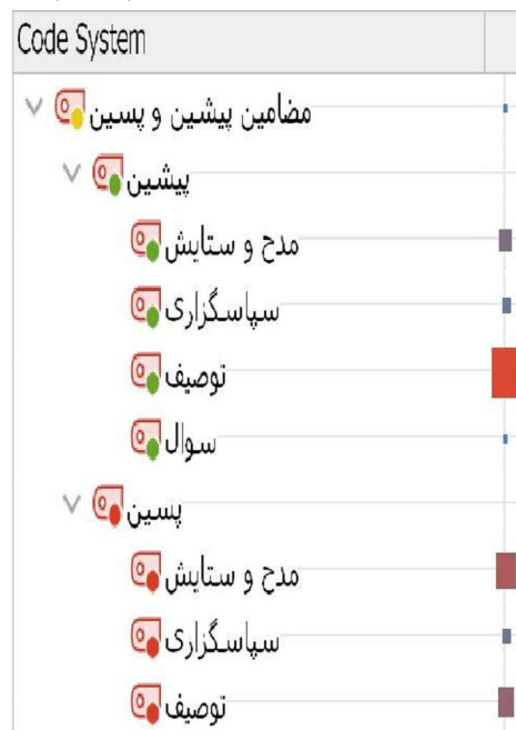
جدول ۱- جدول ماتریکس مضامین پیشین و پسین

نمودار ۱: نمودار Max map، مقایسه فراوانی کدهای محوری با فراوانی بیشتر (مدل توصیفی مضامین پیشین و پسین دعا)